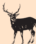
Dziczyzna czarna i płowa