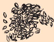
Brytyjskie brązowe siemię lniane